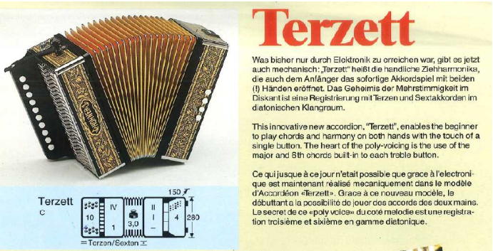
Auszug aus HOHNER-Prospekt