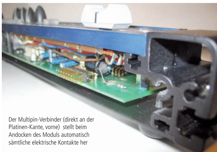
Der Multipin-Verbinder (direkt an der Platine-Kante, vorne) stellt beim Andocken des Moduls automatisch sämtliche elektrische Kontakte her