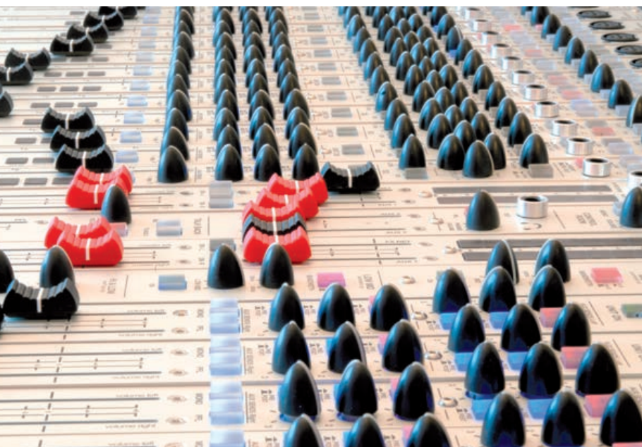
Faszination der Möglichkeiten: Schertler „Arthur“