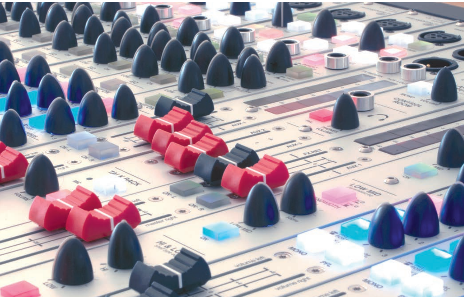
Sieg der Knöpfe: Schertler „Arthur“ Modular-Mischpult